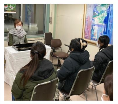
辞令交付式を行いました！